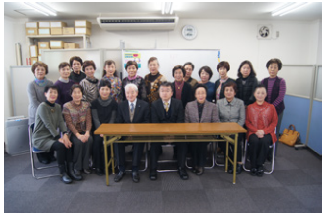
勉強会に参加された皆様

勉強会終了後、税理士無料相談会の受付や青色コーナーへの出向などの出向予定表の作成を行いました。申告期も会活動のお手伝いを行っています。